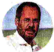
MARIO CUCINELLA Architetto

«Avevamo come vincolo della progettazione il concept dell'ospedale modello di Renzo Piano e Umberto Veronesi: obiettivo, umanizzare l'ospedale. Gli abbiamo tolto un po' della rigidità che quell'impianto inevitabilmente aveva dopo dieci anni e abbiamo introdotto una serie di elementi creati con l'obiettivo di portare dentro la malattia e