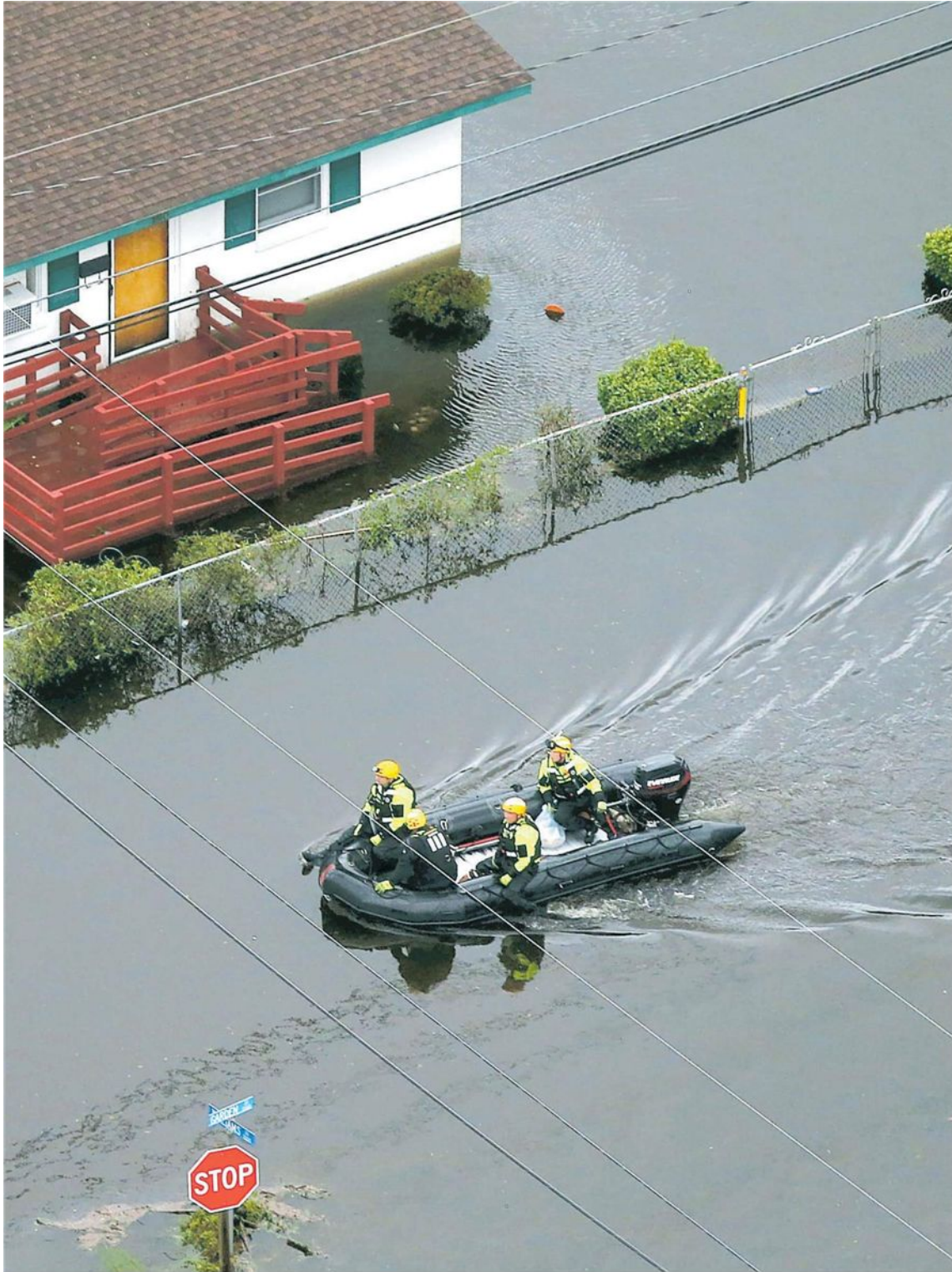
Soccorsi alle vittime di Florence in North Carolina: 10mila i soldati mobilitati