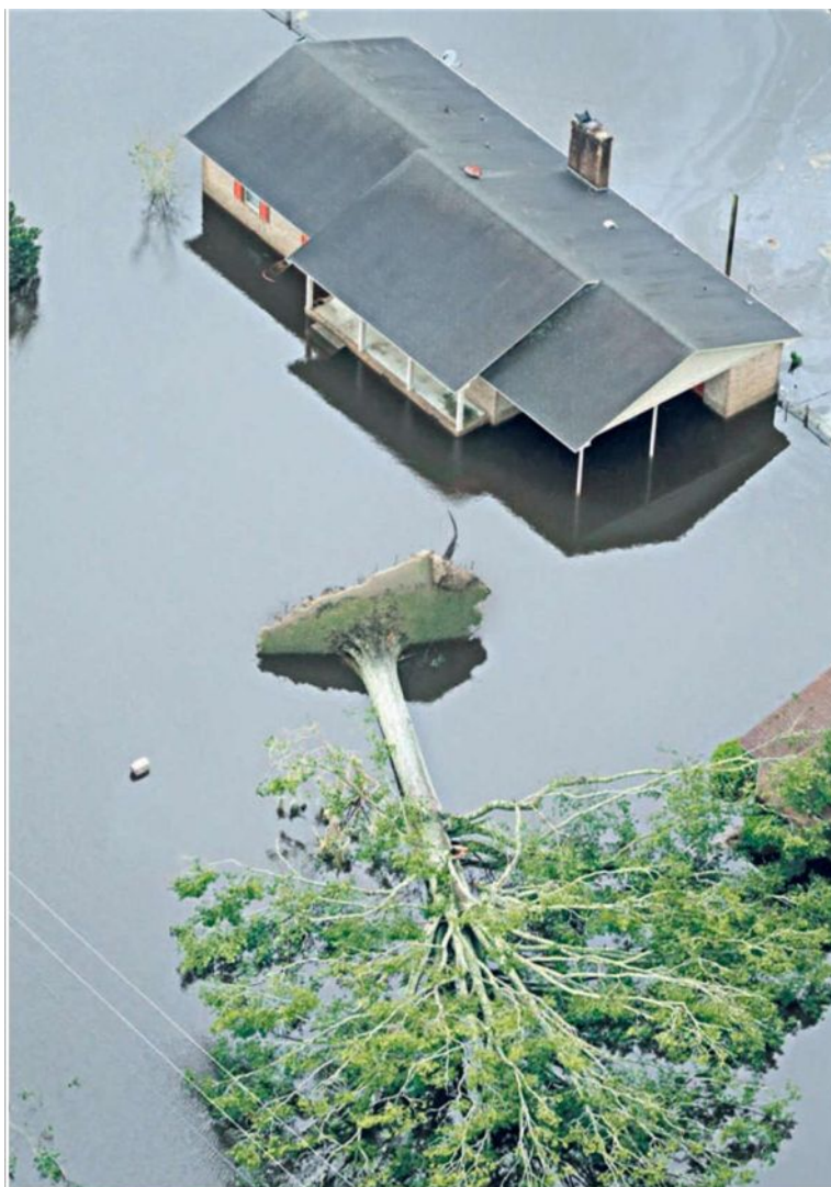
I danni dell'uragano Florence in Carolina del Nord, Stati Uniti

FEDERICO RAMPINI e FILIPPO SANTELLI, pagine 12 e 13