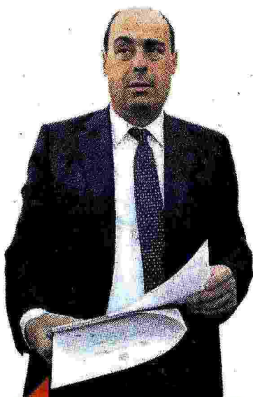
IL GOVERNATORE Nicola Zingaretti dal 2013 è alla guida della Regione Lazio

* Somma dei tassi di inflazione annuali negli anni del periodo