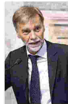
DELRIO Il ministro dei Trasporti e delle Infrastrutture Graziano Delrio ha appena ricevuto dalla Società Autostrade il progetto definitivo della gronda di Genova

L'opera sfiora i 4 miliardi di euro ed è molto complessa se supera questa fase si va al documento esecutivo