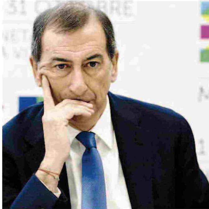
L'amministratore delegato di Expo spa Giuseppe Sala

In dubbio i lavori per le architetture di servizio e il canale affidati alla indagata Maltauro