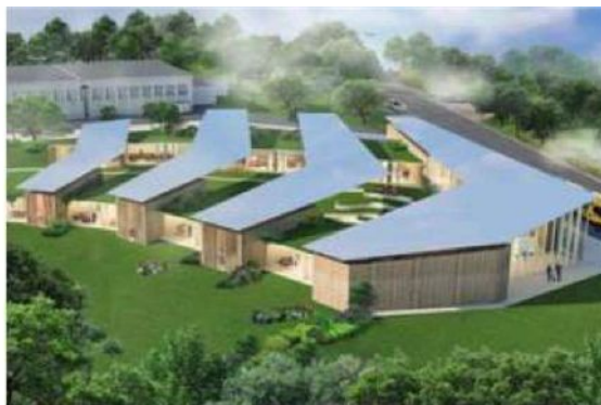
■ Scuola a Cupramontana. Il progetto vincitore