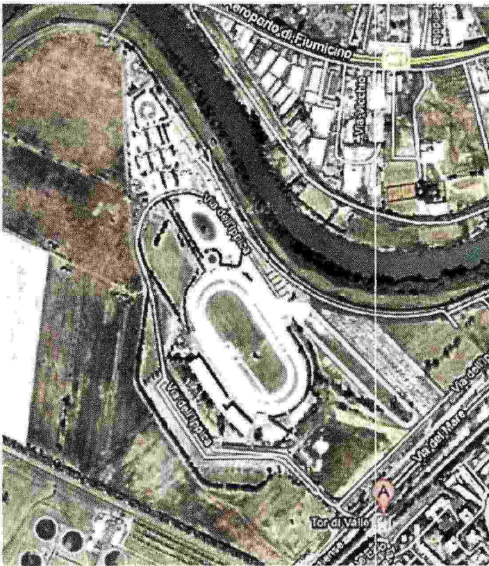
L'area in cui dovrebbe sorgere lo stadio della Roma