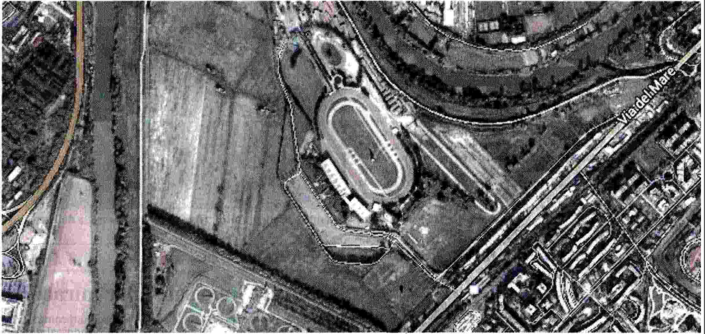
L'area in cui dovrebbe sorgere il nuovo impianto