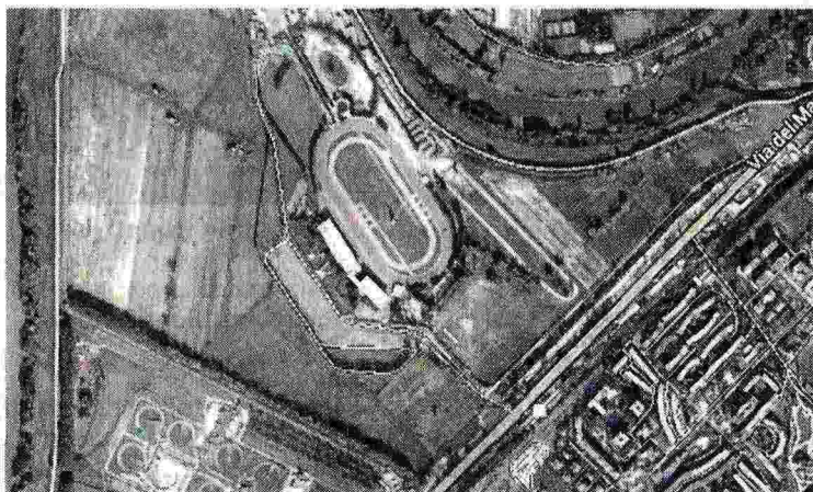
L'area in cui dovrebbe sorgere lo stadio