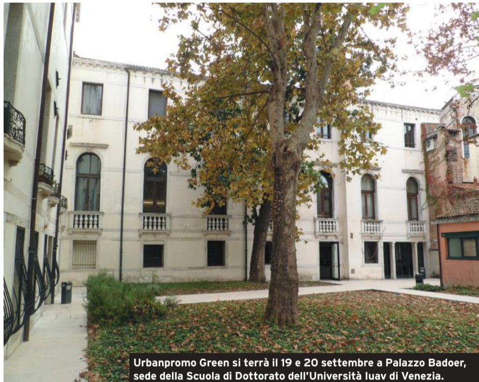
Urbanpromo Green si terrà il 19 e 20 settembre a Palazzo Badoer, sede della Scuola di Dottorato dell'Università Iuav di Venezia.