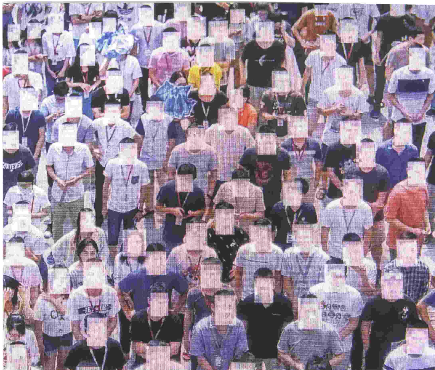
Una dimostrazione di riconoscimento facciale in mostra nel quartier generale di Huawei a Shenzhen