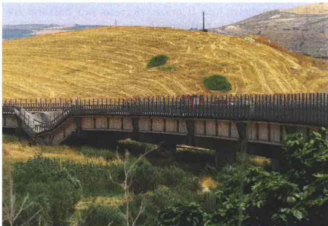
La campata crollata del viadotto Petrulla lungo la statale 626, nella zona di Licata (Agrigento)

→ perché è già d'accordo con il vincitore prefissato. E in questo modo vengono facilitate anche le manovre o i ricatti successivi, per evitare ricorsi in caso di appalti palesemente illegittimi».