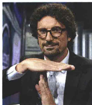
Danilo Toninelli, ministro delle Infrastrutture e dei Trasporti. A sinistra: tecnici al lavoro sul ponte Morandi a Genova

La novità più contestata dai pm antimafia è la legalizzazione dei subappalti fino al 50 per cento del valore dell'opera, quasi il doppio del limite precedente (30). Il procuratore generale di Ancona, Sergio Sottani, è «molto preoccupato per l'aumento dei rischi di infiltrazioni nei cantieri delle zone terremotate: i subappalti e i cosiddetti noli a freddo sono da anni la via maestra per l'ingresso di imprese mafiose». L'alto magistrato, in carica dall'autunno 2017, ha siglato vari accordi con Anac, prefetture e direzione nazionale antimafia, proprio per evitare che i lavori nelle Marche (e nelle altre regioni colpite) possano risolversi nell'ennesimo scandalo di corruzione, criminalità e malgoverno del territorio. «Le imprese mafiose non hanno i requisiti per aggiudicarsi direttamente le gare d'appalto», avverte il procuratore: «L'esperienza ci insegna che subentrano dopo, in corso d'opera, con minacce, inti- →