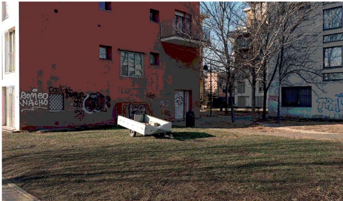
Sopra: stabili degradati nell'area del Lingotto, dove ci sono tensioni tra immigrati e italiani. Nell'altra pagina, in alto: un palazzo mai terminato tra gli sterrati di corso Grosseto, zona Borgo Vittoria; in basso: gli ex mercati generali in stato d'abbandono