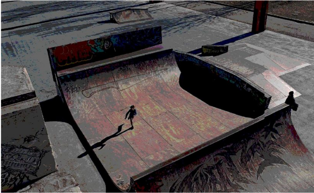
Sopra: il parco Dora, tra la zona di San Donato e Borgo Vittoria, a Torino. A destra, in alto: il campo Rom di via Germagnano, periferia nord della città; in basso: corso Giulio Cesare, che da Barriera di Milano attraversa la zona Regio Parco e porta verso l'A4