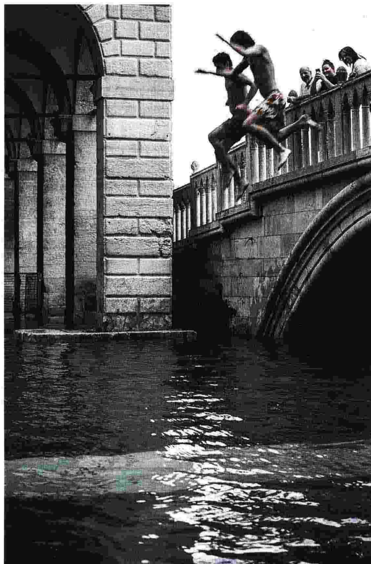
Tuffi nel canale La sfida di tuffi tra giovani dal ponte della Paglia, a Venezia. È solo uno dei tanti episodi fuori luogo che si sono registrati negli ultimi giorni in Laguna, dove si moltiplicano le intemperanze da parte di alcuni turisti