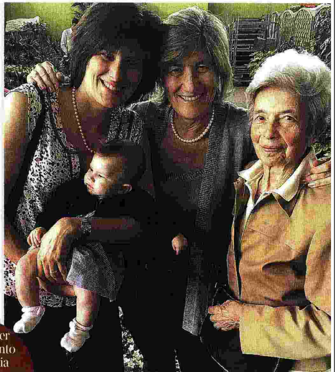
Con il leader del Movimento e in famiglia