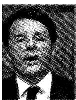
Il premier Matteo Renzi

l'occupazione. In pochi mesi partono 650 cantieri, vengono consegnati 2.800 appartamenti a settimana. Alla fine dei primi sette anni del piano sono stati costruiti 735 mila vani per un valore di 334 miliardi di lire. Alla scadenza del quattordicesimo anno i vani sono 2 milioni e l'incremento dell'occupazione di 41 mila lavoratori all'anno. Non altrettanto felici furono gli anni successivi con la Gescal, con investimenti dello Stato e trattenute su datori di lavoro e lavoratori. Al piano Fanfani lavorarono architetti,