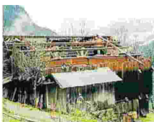
Rischio idrogeologico Sopra, gli effetti delle piogge a San Pietro in Cadore (Belluno). Sotto, i danni del vento nel Bellunese e allagamenti nella golena del Piave in provincia di Venezia