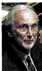
Qui sopra: l'architetto Renzo Piano (Genova, 1937) è senatore a vita. In alto: Pescara del Tronto

La formula Lo Stato investa. Metta subito in sicurezza scuole e ospedali. Poi finanziamenti sul modello degli Ecobonus