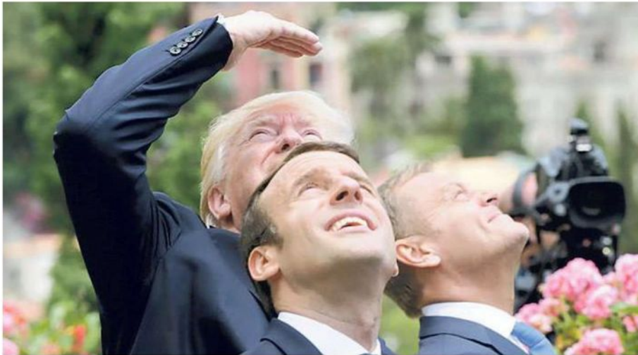
Trump, Macron e Tusk durante il G7 di Taormina