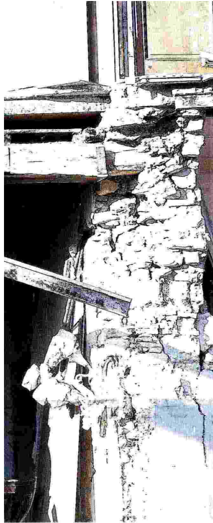
Come erano. Un Vigile del Fuoco all'interno di una casa sventrata dal sisma del 24 agosto ad Amatrice.