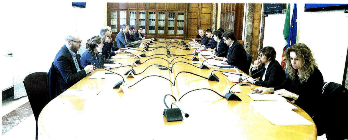
A Reggio Calabria. Via libera definitivo del Consiglio dei ministri, che si è tenuto ieri in Prefettura, al Di sblocca-cantieri

I lavori per ricostruire gli edifici privati nel Centro Italia potranno essere affidati all'impresa senza più l'obbligo di una «procedura concorrenziale» in cui vengano messe a confronto le offerte di almeno tre imprese. Il massimo ribasso sui servizi di progettazione viene esteso anche ai progetti di pianificazione urbanistica