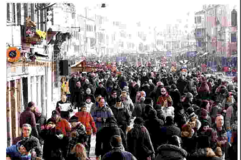
Folle di turisti. Nella foto grande Venezia. Qui sopra, dall'alto: il centro di Firenze, le Cinque terre, San Gimignano