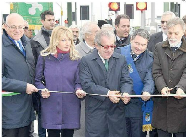
Taglio del nastro. Le autorità presenti ieri a Travagliato (Brescia)

■ La Brebemi ha liberato dal traffico i Comuni dell'area interessata dall'infrastruttura (il traffico pesante sulla A35 è circa il 30% del totale) riducendo i tempi di percorrenza e le emissioni di CO2 e ha valorizzato il territorio. Prova di questa crescita sono anche i diversi operatori nazionali e internazionali che hanno già scelto l'area attraversata da Brebemi per investire in poli logistici e imprese