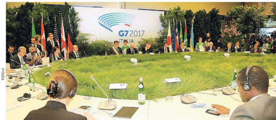
I rappresentanti dei Paesi al G7 di Bologna sull'ambiente. Al centro del tavolo un simbolico prato verde

A fianco di Galletti si sono schierati ieri sia il premier Paolo Gentiloni che l'ex premier Matteo Renzi, al termine di una giornata in cui non ci sono stati i temuti scontri con i manifestanti. Un migliaio di attivisti ambientalisti hanno sfilato pacificamente per le vie del centro, mentre il summit si teneva in un grande albergo in periferia, con uno spiegamento davvero massiccio di forze dell'ordine in tutta la città.