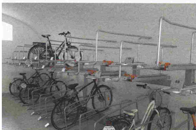
A Bari, grazie a un accordo tra la Regione Puglia e le Ferrovie Appulo Lucane, a inizio marzo è stata inaugurata la prima velostazione all'interno degli spazi attualmente inutilizzati della stazione di Corso Italia. L'edificio garantisce il parcheggio a 116 biciclette, 24 ore su 24, sistemate in una struttura portabici a parete, a due piani.

veicoli a motore. Gli unici mezzi elettrici catalogati come biciclette sono quelli dotati di un sistema di pedalata assistita, facilitata cioè da un motore elettrico. Le bici a pedalata assistita (chiamata anche «pedelec») hanno un motore ausiliario elettrico con una potenza nominale continua massima di 0,25 kW; l'assistenza si interrompe non appena si raggiunge questo limite, o prima se il ciclista smette di pedalare. L'uso dell'acceleratore è ammesso dal Codice della strada soltanto se questo è subordinato al movimento dei pedali, mentre quando questo dispositivo non è subordinato al sensore di pedalata, la bici non è idonea alla circolazione. Tuttavia, nel linguaggio comune si parla di bicicletta elettrica anche in presenza di un motore di potenza superiore a 250 W, che raggiunga velocità superiori ai 25 Km/h, con o senza dispositivo di accelerazione; è bene dunque sottolineare che in questo caso siamo di fronte a un veicolo a motore e non a una bicicletta.