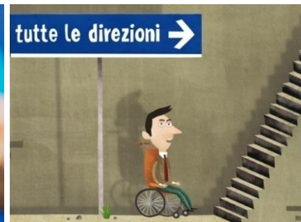
No Barriere online Ass. L. Coscioni (2016)