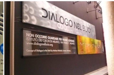
Dialogo nel buio, Istituto dei Ciechi, Milano (2007)