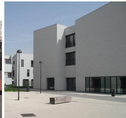
Universal design, The Norwegian Ministry. of the Environment (2007)