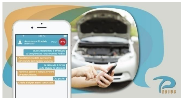
App traduttore di suoni in testo scritto, Pedius (2016)