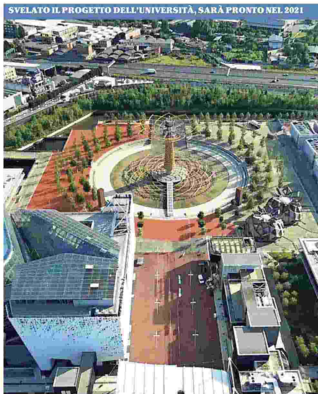
La zona del cardo nell'area Expo sarà parzialmente destinata al nuovo campus dell'Università Statale

OBIETTIVO RHO-PERO L'area dell'Expo deve essere convertita dopo la totale demolizione dei padiglioni 2015: la Statale si candida a costruire un nuovo campus