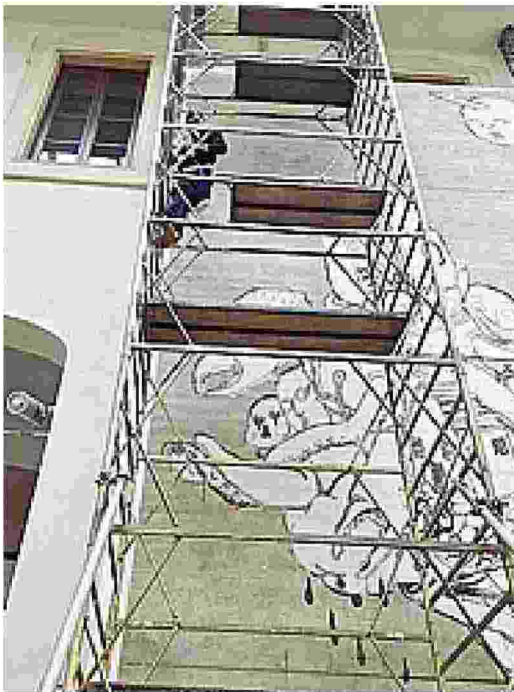
Un graffito di Blu durante l'allestimento a Palazzo Pepoli

● Domenica, sul muro ormai grigio del centro sociale XM24, dove c'era l'opera più amata e ammirata, è comparsa questa scritta (foto), citazione dell'anarchico Jules Bonnot e titolo di un romanzo di Pino Cacucci. La stessa frase «in ogni caso nessun rimorso» fu utilizzata dall'attuale sindaco Virginio Merola durante la campagna per le primarie che lo videro poi sconfitto da Flavio Delbono