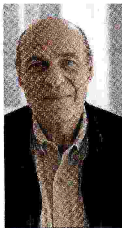
LO STORICO Jean-Louis Cohen è nato a Parigi nel 1949. Insegna al New York Institute of Fine Arts. In Italia ha pubblicato le monografie di Mies van der Rohe (Laterza) e Le Corbusier (Taschen)

La rassegna, curata da Jean-Louis Cohen, spazia dai paesi europei agli Stati Uniti