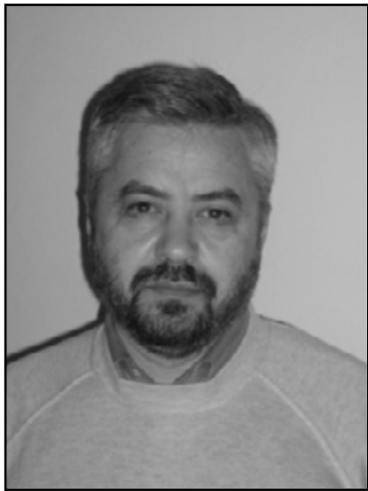
Giuseppe De Luca Segretario generale INU

Il futuro delle città dipende dalla nostra capacità di favorirne l'adattamento ai grandi cambiamenti in atto (climatici, economici, sociali), ma soprattutto a ricercare le radici per definire progetti di rigenerazione che ridiano speranza in questa turbolenta fase di trasformazione globale.