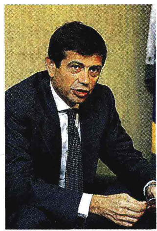
Il ministro Maurizio Lupi, ministro dei Trasporti e delle infrastrutture

La lettera Il frontespizio della missiva del ministro delle Infrastrutture. Nell'oggetto: «Istruttoria per la manovra di finanza pubblica 2014-2016»