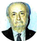
Il via agli avvisi.

Procedura formalmente aperta per le gare della Torino-Lione, è la decisione, unanime, dei membri del Consiglio di amministrazione di Telt, il promotore pubblico dell'opera. La decisione presa durante una seduta in videocollegamento tra Parigi e Roma, è quella di pubblicare gli avvisi di avvio delle gare – per un importo stimato di circa 2,3 miliardi per i lavori di scavo del tunnel di base sul versante francese, suddiviso in tre lotti – con un esplicito riferimento alla cosiddetta “clausola di dissolvenza”, la facoltà in capo a Telt «di interrompere senza obblighi e oneri la procedura in ogni sua fase». La soluzione nasce nel quadro di quanto previsto dal Codice degli appalti francese, era nell'aria da settimane ma ha avuto un ok politico dopo gli incontri tra il premier Giuseppe Conte e il direttore generale di