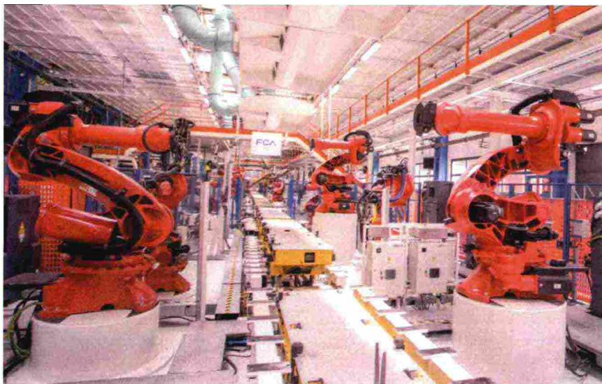
La linea robotica per la produzione della nuova Fiat 500 elettrica al Mirafiori Motorvillage di Torino

pianeta», dice Toussaint. Fonti diplomatiche polacche fanno sapere che il Paese sta facendo il possibile per riconvertire l'economia dai fossili ma che «a causa del comunismo» sono indietro di 50 anni e che forse in questo momento l'Europa non dovrebbe caricarsi da sola tutto il peso della transizione ecologica.