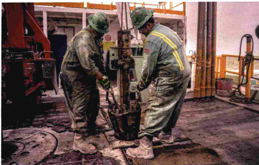
Operai al lavoro nel bacino petrolifero Permian di Midland, Texas, 400 chilometri a ovest di Dallas

Le lobby dei fossili, della plastica, dei trasporti sono al lavoro per convincere i governi che la rivoluzione ecosostenibile può attendere. Che l'emergenza insegna che non tutto "il vecchio" è brutto. E che senza le tradizio-